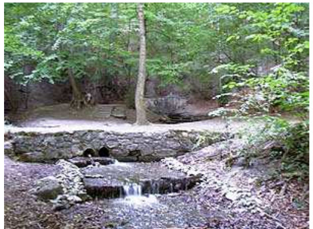
Bild 2: Das Gefälle vom Berghang, an dem die Quelle austritt, wird durch ein gestuftes Schotterbett überwunden. Dann aber darf der Bach etwas freier fließen.