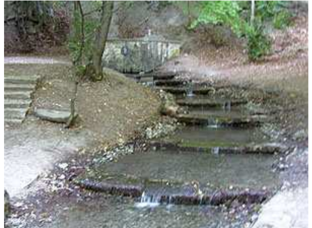
Bild 1: Wie an vielen Quellen ist auch hier eine Steinfassung vorgenommen worden. Recht fragwürdig gegenüber der Natur. Aber immerhin wird dadurch das Wasserholen erleichtert. Kein Scherz - zu beobachtende Praxis!

Wer oder was hier verehrt wurde, welche konkreten Vorstellungen mit den Opfergaben verbunden waren, lässt sich nicht sagen. Bei der Objektstreuung über mindestens eineinhalb Jahrtausende bleibt fraglich, ob die Bedeutung