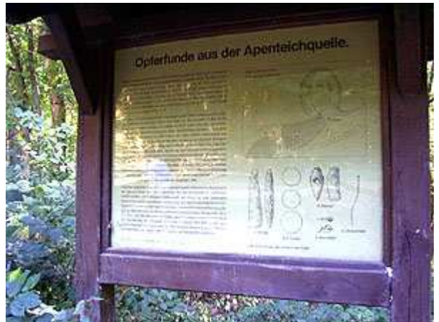
Bild 4: Und mit der Frage nach der Art der Opfer und der Zeitstellung wird man auch nicht ganz allein gelassen. Eine Tafel gibt Auskunft.